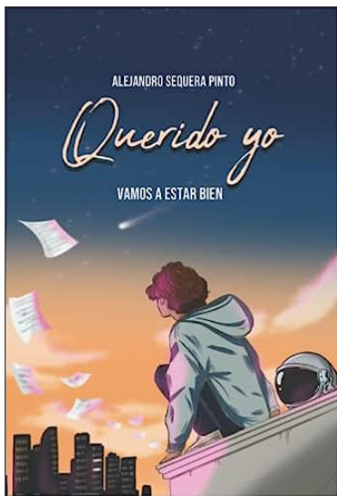
Reseña En La Página 14